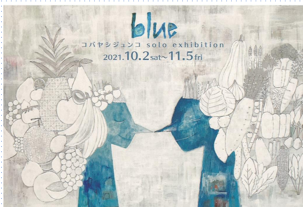
『hongii ~ 野菜王子と果実姫 ~』